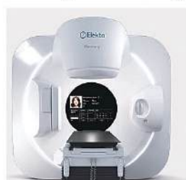
図3 2025年9月から最新型リニアック3台の同時稼働